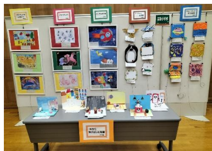
【昨年の展示のようす】