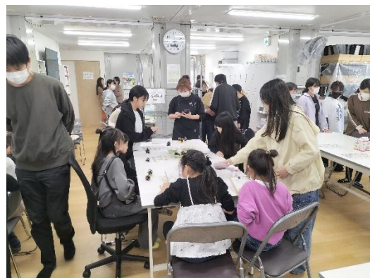
まつぼっくりアート