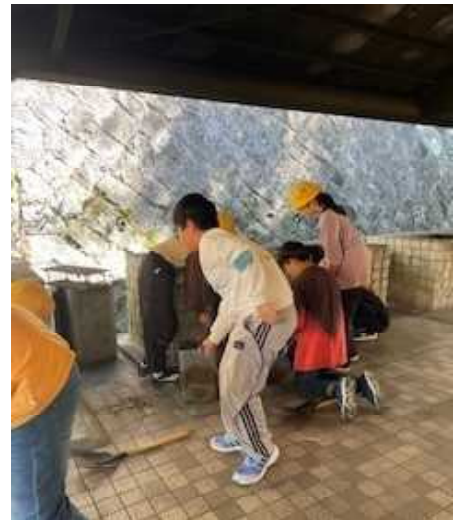
【カレーライスづくり】

10月11日（金）12日（土）、5年生が旭高原自然の家（豊田市）で緑の学校を実施しました。ハイキングでは、秋の清々しい空気を感じながら歩くことができました。野外炊飯では、学校で練習したときよりも上手にカレーライスづくりができました。静かな雰囲気の中、厳かに始まったキャンプファイヤーでは、子どもたちの自然に感謝する気持ちが一つにそろいました。そして、火の神からの聖なる火をもらうと、火に込められた思いを心で感じる事ができました。井桁に点火されると、ボン・ファイヤー！！ 限られた時間で準備してきた出し物を見せ合い、はじけることができました。楽しかったときに終わりを迎えるのはとても寂しいようでした。たくさん思い出を胸に旭高原を後にしました。