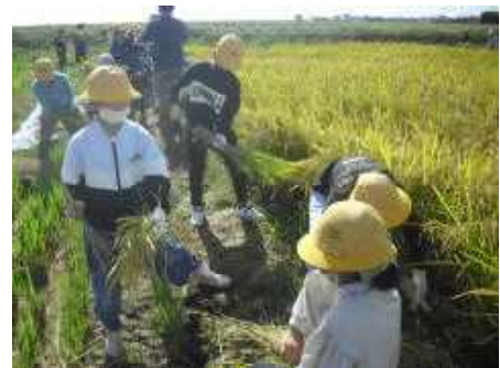
【上手に鎌で刈り取りました】