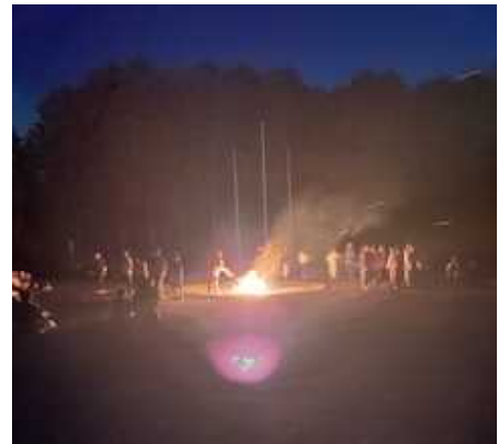
【ボン・ファイヤー！！】

体験後には、子どもたちは、「楽しかった」「楽しかったけれど、腰を曲げたまま作業するのが大変だった」「みんなで力を合わせてがんばった」「田植えと稲刈りの両方を体験できてよかった」「もっとやりたい」と話し、稲刈り体験を楽しむことができました。更に日本の米づくりや農業のことを学んでほしいと願っています。