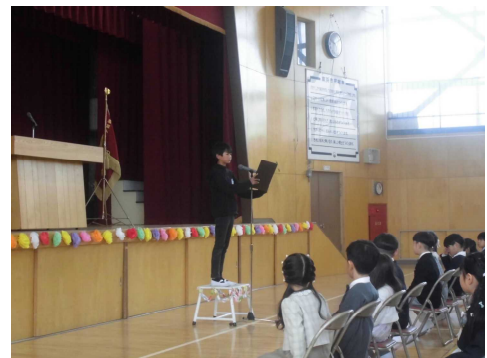
【6年 ST さん】